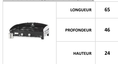
Dimensions de l'appareil Plancha (en cm)