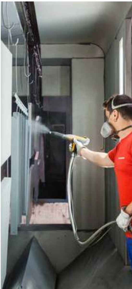
* Barbecues Mendy, Montory, Irissarry et le Barbecue Français.