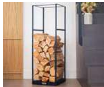
Collection d'accessoires à la ligne épurée et contemporaine