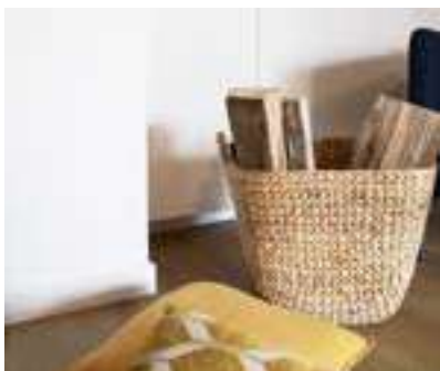
Gamme d'accessoires basiques pour la cheminée et la décoration